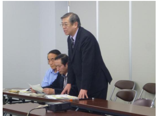
石川氏による発表の様子