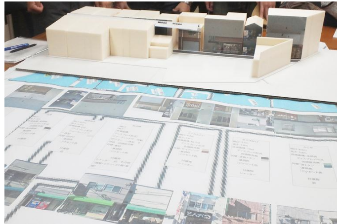
平成 24 年度に行われた神奈川大学学生による商店街側へのプレゼン風景