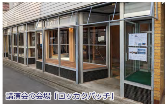
講演会の会場「ロッカクパッチ」

※会場の席数に限りがあります。やむを得ずご来場枠を確保できない場合は、Zoomアドレスをご案内する場合があります。ご了承下さい。