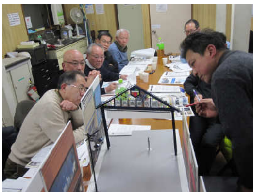
環境整備部会でのデザイン検討の様子

プロポーザルの結果、採用されたアーチ及び街路灯のイメージ(この案を基本に検討・設計を行なっています)