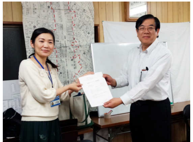
まちづくりプラン認定通知書授与の様子

今後、この地域まちづくりプランと、昨年認定された「六角橋商店街地区まちづくりルール（全体区域）」を併用し、災害に強く魅力のある商店街を目指し、まちづくり活動を行なっていきます。