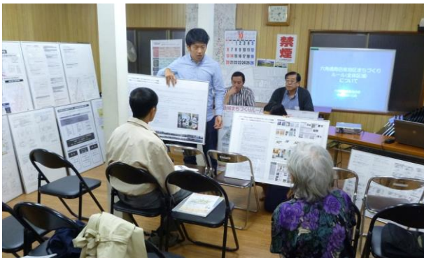
説明会の様子（神奈川大学の学生によるまちなみ意匠に関するワーキング中間報告）

六角橋商店街連合会では、平成26年3月6日に行われる地域まちづくり推進委員会でのルール認定変更に向け準備を行っていきます。