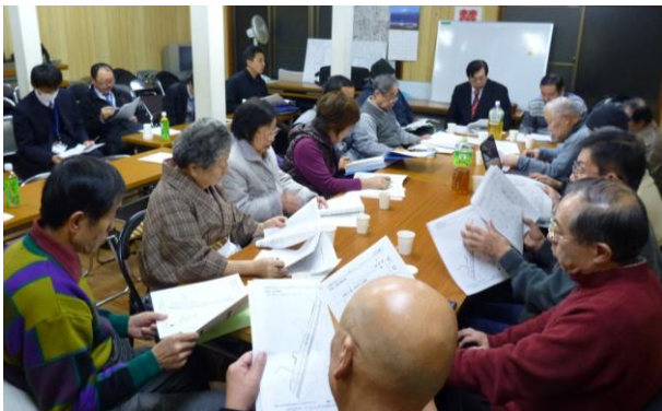
六角橋商店街連合会臨時総会の様子